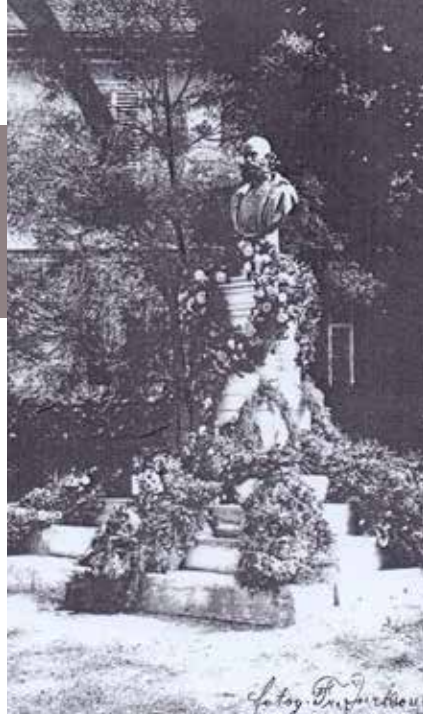
Spomenik Franca Jožefa I., 1898. V spomin na njegovo 50-letnico vladanja je ob šolski svečanosti kip z venci okrasila šmarska šolska mladina.

Priljubljenost Franca Jožefa se je nadaljevala v čas prve svetovne vojne. V Knjižnici Šmarje pri Jelšah hranimo spominske razglednice iz vojnega časa, ko so v slovenskih in tudi drugih krajih monarhije na razglednicah upodabljali cesarja, vojake in svoj kraj. Težko je ugibati, kaj so ljudje v resnici mislili in kako so doživljali vladarja, saj je javno izražanje kritičnih stališč o cesarju in