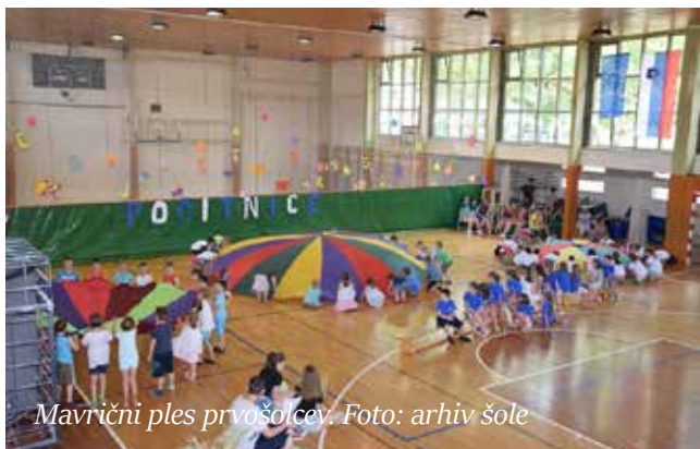
Mavrični ples prvošolcev.