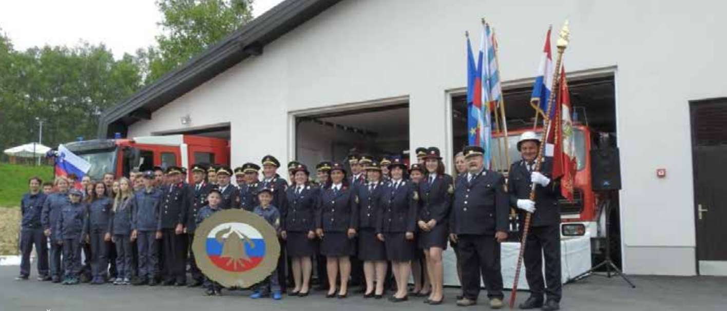
Člani PGD Šentvid na slavnostni dan.