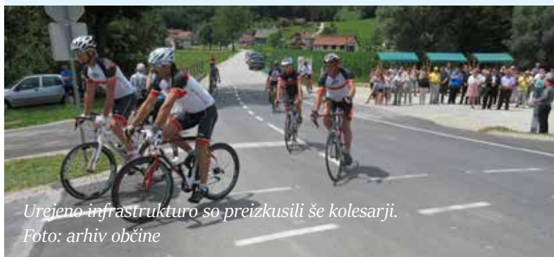
Urejeno infrastrukturo so preizkusili še kolesarji.