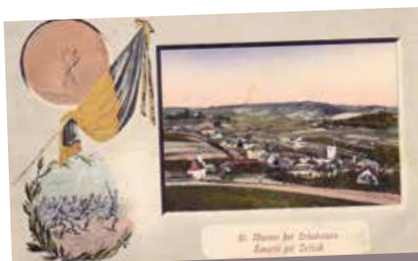
Spominska vojna razglednica. *** Domoznanski oddelek Knjižnice Šmarje pri Jelšah.