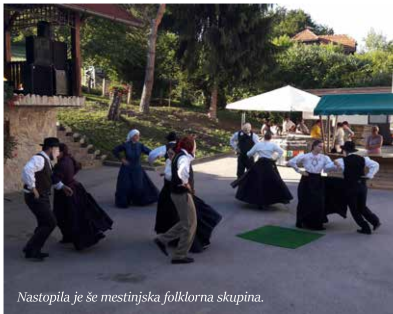
Nastopila je še mestinjska folklorna skupina.