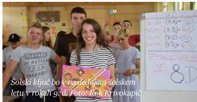
Šolski ključ bo v naslednjem šolskem letu v rokah 9. d.