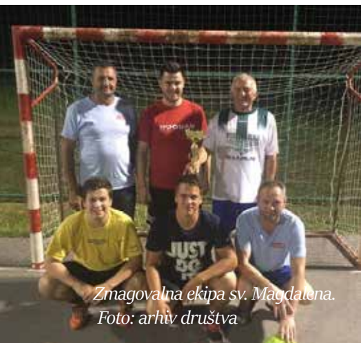
Zmagovalna ekipa sv. Magdalena.