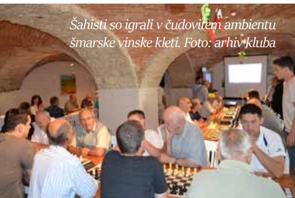
Šahisti so igrali v čudovitem ambientu šmarske vinske kleti.