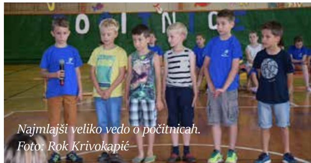
Najmlajši veliko vedo o počitnicah.