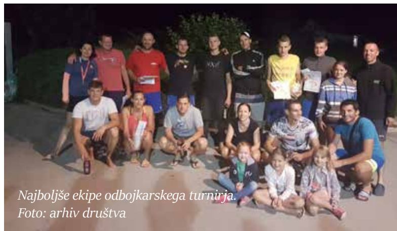
Najboljše ekipe odbojcarskega turnirja.

V soboto, 1. julija, smo organizirali že 15. tradicionalni turnir v odbojki na mivki za pokal Jakoba Sketa. V društvu smo prepričani, da vsako leto organiziramo eden najbolj kakovostnih turnirjev v okolici. Verjetno tudi zaradi izjemno prijetnega vremena, primerne za igranje odbojke na mivki, se je letošnjega turnirja udeležilo kar 11 ekip, zato smo bili z udeležbo zelo zadovoljni. Vse popoldne in del noči smo spremljali kar 30 zanimivih tekem, najprej v predtekmovanjih, polfinalnih tekmah in še končnih odločitvah. Prvo mesto je osvojila ekipa Rana ura, sestavljena, kot so sami povedali, »z vseh vetrov«. Drugo mesto je osvojila ekipa Samba, sestavljena iz domačih igralcev, tretje mesto pa ekipa Jezna pest, sestavljena iz igralcev »šentjurskega konca«. Za prve tri ekipe smo pripravili lepe pokale in priznanja, nagrajene so bile tudi vse ekipe od prvega do četrtega mesta z darili, ki so jih prispevali donatorji in sponzorji.