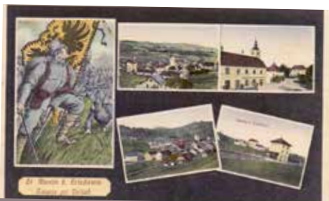
Spominska vojna razglednica.