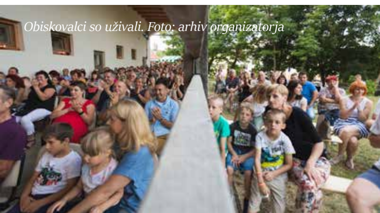
Obiskovalci so uživali.