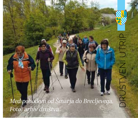
Med pohodom od Šmarja do Brecljevega.

Lepo število upokojsencev se je udeležilo pohoda iz Šmarja do Brecljevega in naprej do Jazbin. Na Brecljevem smo si ogledali cerkev sv. Tomaža in prisluhnili zanimivi razlagi gospe Strašek o zgodovini cerkve. Ustavili smo se v podjetju Vitli Krpan, ki je vsakoletni sponzor našega društva. Prisluhnili smo izčrpnim razlagi o zgodovini in razvoju podjetja ter si ogledali proizvodnjo. V hladnem in deževnem vremenu nam je prijala pogostitev, ki so nam jo pripravili.