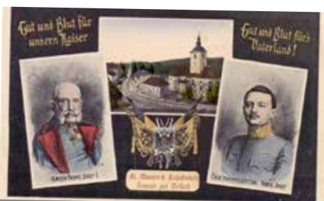
Spominska vojna razglednica, Franc Jožef I. in njegov naslednik Karl Franc Jožef, trg Šmarje pri Jelšah.