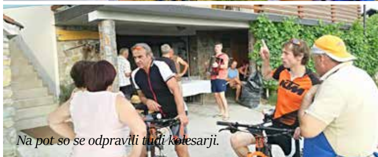
Na pot so se odpravili tudi kolesarji.