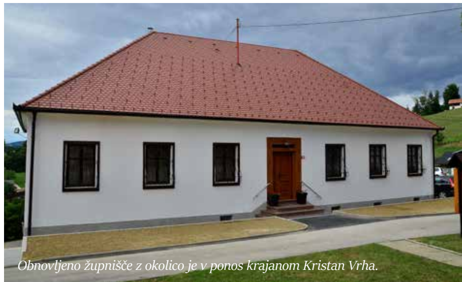
Obnovljeno župnišče z okolico je v ponos krajanom Kristan Vrha.

Naj omenimo še bogato vsebino župnijske knjižnice. Ponaša se s številko več kot 2.500 knjig. V njej najdemo najrazličnejše izvode svetih pisem, obredne knjige, molitvenike, prav tako posvetno literaturo - leposlovje in leksikone ter knjige za otroke in mladino. Dve knjigi iz bogate zbirke zaradi posebnih pogojev hranijo v sefu župnišča Šmarje pri Jelšah, in sicer faksimile Dalmatinove Biblije iz leta 1584 in posebno ročno vezano izdajo Biblije, ki je bila natisnjena le v 1000 izvodih in je leta 2008 izšla v Sloveniji.