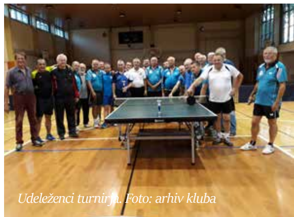
Udeleženci turnirja.