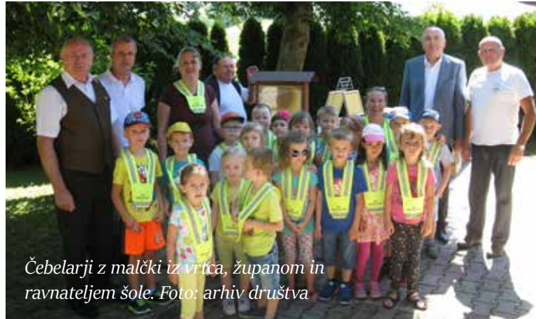
Čebelarji z malčki iz vrtca, županom in ravnateljem šole.

Namen dneva odprtih vrat je bil seznaniti naše potrošnike, ožjo in širšo javnost o skrbi čebelarjev za pridobivanje kakovostnih in varnih čebeljih pridelkov. Ljudem želimo povedati, da so čebelji pridelki popolnoma naravno živilo, saj jim čebelarji v postopkih pridelave ničesar ne dodajamo, niti ne odvezemamo. S predstavitvijo čebelarstvih opravil in čebeljih pridelkov želimo