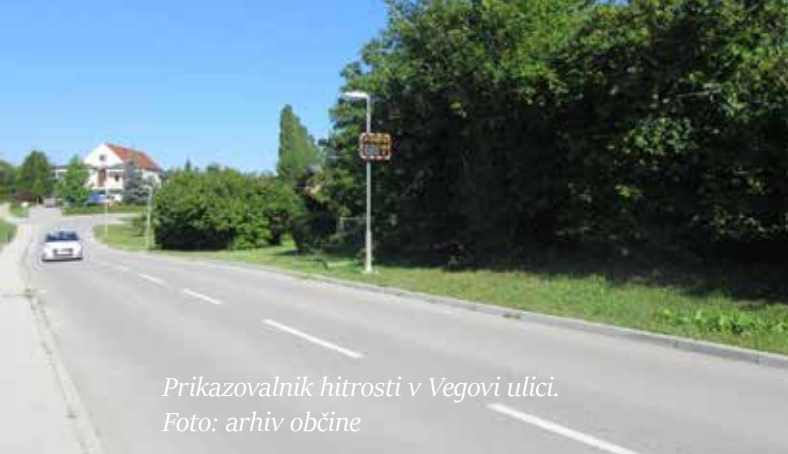
Prikazovalnik hitrosti v Vegovi ulici.