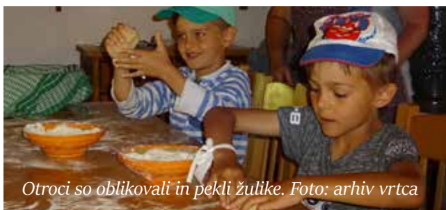
Otroci so oblikovali in pekli žulike.

Kosilu v obliki piknika je sledil počitek. Nekateri so se v tem času odpravili domov, preostali so se lotili postavljanja šotorov. Pred večerjo so se družine v spremstvu vodičke in prisotnih zaposlenih odpravile na bližnji hrib Bukovje. Seveda je večerji sledil taborni ogenj in