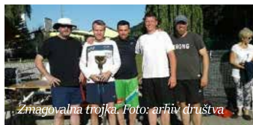
Zmagovalna trojka.