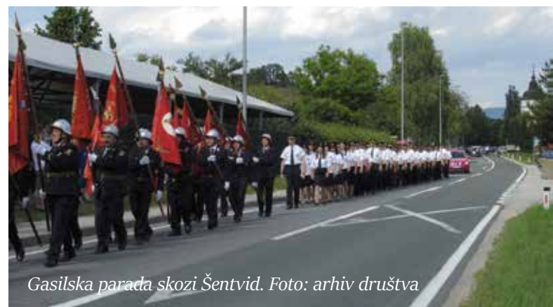
Gasilska parada skozi Šentvid.