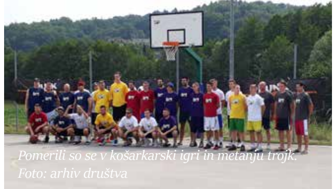
Pomerili so se v košarkarski igri in metanju trojčk.

Za bogate nagrade je v prvi vrsti poskrbela specializirana košarkarska trgovina DunkShop.si. Skupno je nagradni fond znašal okrog 1000 evrov, večinoma v obliki praktičnih nagrad in bonov. Turnir je bil drugi zapovrstjo, vsekakor pa ne zadnji. Odziv udeležencev in mimoidočih je zelo lepa spodbuda za trud v prihodnje. Zahvala gre vsem sponzorjem in prostovoljcem, ki so s svojo dobro voljo prispevali k izvedbi košarkarskega dogodka. Vsi sponzorji in donatorji, ki so pripomogli k izvedbi dogodka: DunkShop, MOS, Delavska hranilnica, Trgovine Jager, Vital Mestinjje, Mesnica Boček, Podoba tisk, Etol, Kozmetika Afrodita, Athlete, Terme Olimia Podčetrtek, Steklarna Rogaška, Občina Šmarje pri Jelšah.