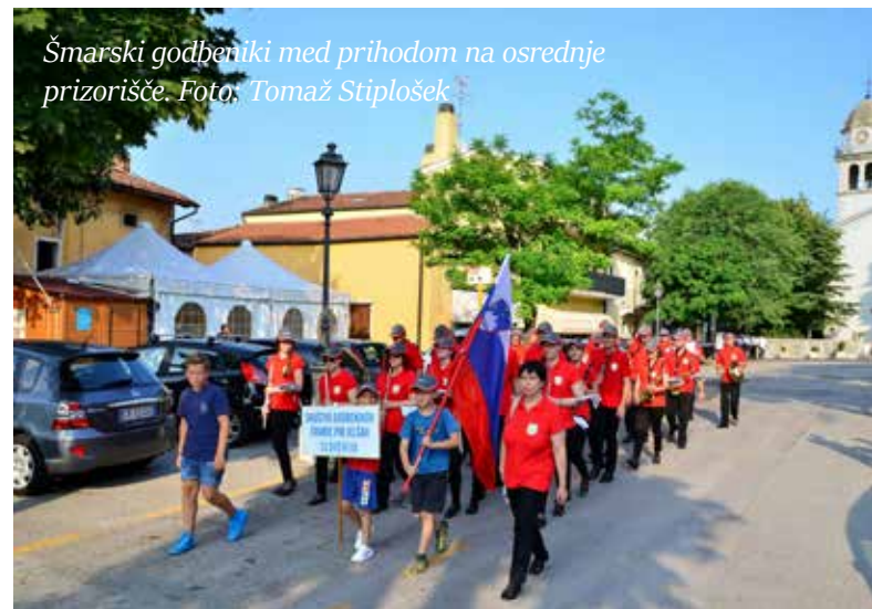
Šmarski godbeniki med prihodom na osrednje prizorišče.

Nabrežinski godbeniki so se izkazali kot odlični gostitelji. Godbenikom iz Šmarja so že v dopoldanskih urah