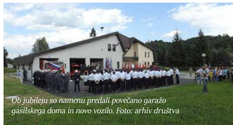
Ob jubileju so namenu predali povečano garažo gasilskega doma in novo vozilo.