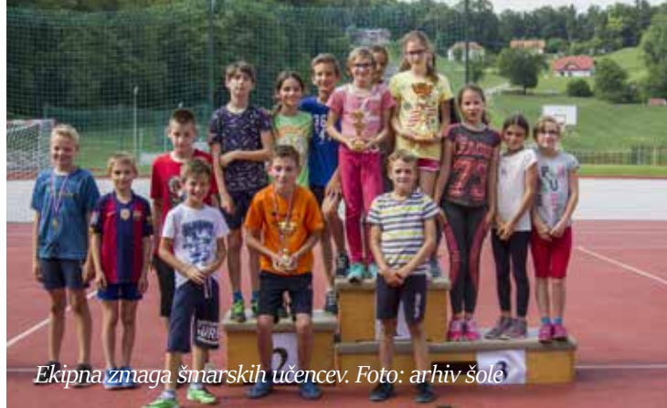
Ekipna zmaga šmarskih učencev.

Naši tekmovalci so posegli po najvišjih mestih. Med dečki je Miha Vrečko dosegel 2. mesto, Tilen Trontelj pa 3. Med deklicami je bila prva Kaja Vrbeč (OŠ Zibika). Dečki so ekipno zasedli 1. mesto, deklice pa 3. Deklice in dečki