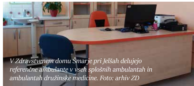
V Zdravstvenem domu Šmarje pri Jelšah delujejo referenčne ambulante v vseh splošnih ambulantah in ambulantah družinske medicine.