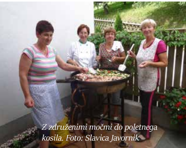
Z združenimi močmi do poletnega kosila.

Topel in nekoliko soparen dan je bil pravi uvod v sezono poletnih piknikov v domu upokojsencev v Šmarju. Na prijeten petek so združile moči udeleženke univerze za tretje življenjsko obdobje Šmarje iz kuharske delavnice, nekaj oskrbovank in oskrbovancev pod vodstvom Slavice Javornik ter pripravile okusno in pestro kosilo v obliki piknika. Že med pripravo piknika smo skupaj obujali spomine, kako smo nekoč pripravljali hrano, kaj smo jedli, vmes pa je kot vedno še kdo povedal kakšno šalo in dopoldan je za vse minil prehitro.