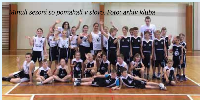
Minuli sezoni so pomahali v slovo.

Košarkarski klub Jelša je ob zaključku šolskega leta in košarkarske sezone 2016/2017 organiziral dan košarke. Staršem in ostalim ljubiteljem košarke v Šmarju pri Jelšah so pokazali, kaj so se najmlajši in malce starejši naučili, so sporočili iz kluba. Na krajših tekmah so se predstavile vse košarkarske selekcije, s katerimi so tekmovali v sezoni. Po zaključku tekem so podelili zahvale za trenersko delo, nato je sledilo košarkarsko druženje s pogostitvijo. Z izvedbo in odzivi na dogodek so bili zadovoljni starši, trenerji in organizatorji. (SJ)