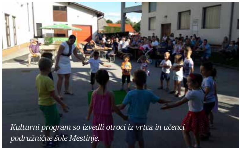
Kulturni program so izvedli otroci iz vrtca in učenci podružnične šole Mestinje.