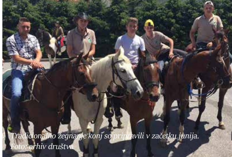
Tradicionalno žegnanje konj so pripravili v začetku junija.

Jezdece smo zjutraj pričakali na kozolcu Konjenice Virštanj-Obsotelje v Imenem in jih preko naših lepih krajev popeljali do našega kozolca, kjer smo jim pripravili obilno kosilo. Potem sta jih naša člana popeljala še drugi del poti do Frankolovega, kjer so jih sprejeli naslednji konjeniki. Gostje so bili navdušeni nad našimi kraji,