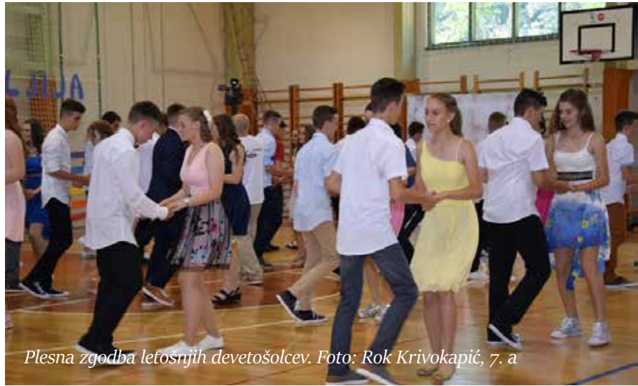
Plesna zgodba letošnjih devetošolcev.

Ravnatelj Mitja Šket jih je na novo pot pospremil z besedami: »Po novi poti stopajte pametno, preudarno in z razmislekom. Vlagajte vase, vlagajte v to, da boste boljši človek.«