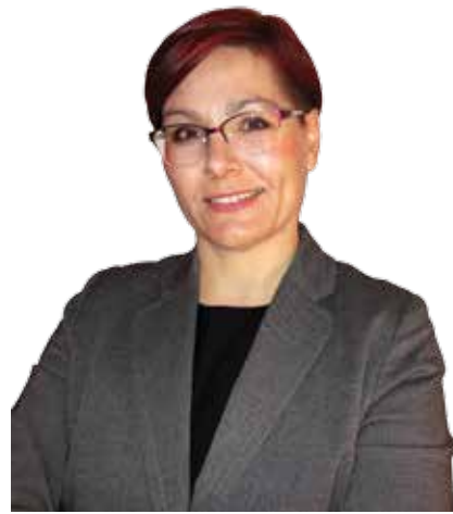
Piše: Sergeja Javornik, odgovorna urednica

Sedmi mesec letos in sedma letošnja številka občinskega glasila Šmarske novice. V vaše domove ponovno prinašamo številne novice o dogajanju in delu na različnih področjih, v občinski upravi in drugih ustanovah, društvih ... Hvala vsem, ki ste se potrudili in pripravili kakovostne prispevke s fotografijami za objavo. Veseli nas namreč, da občinsko glasilo prepoznate kot možnost in priložnost sporočiti soobčanom, kdo ste, kaj počnete, kaj ste dosegli in kaj načrtujete.