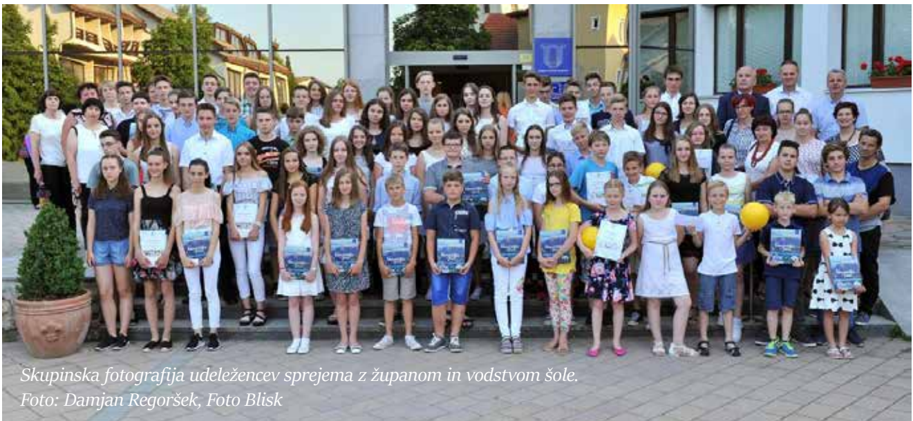
Skupinska fotografija udeležencev sprejema z županom in vodstvom šole.

raziskovalnih nalog. Na sprejem je bilo povabljenih 81 učencev. Celoten seznam učencev z njihovimi uspehi je objavljen na spletni strani smarje.si v rubriki Novice. (S)