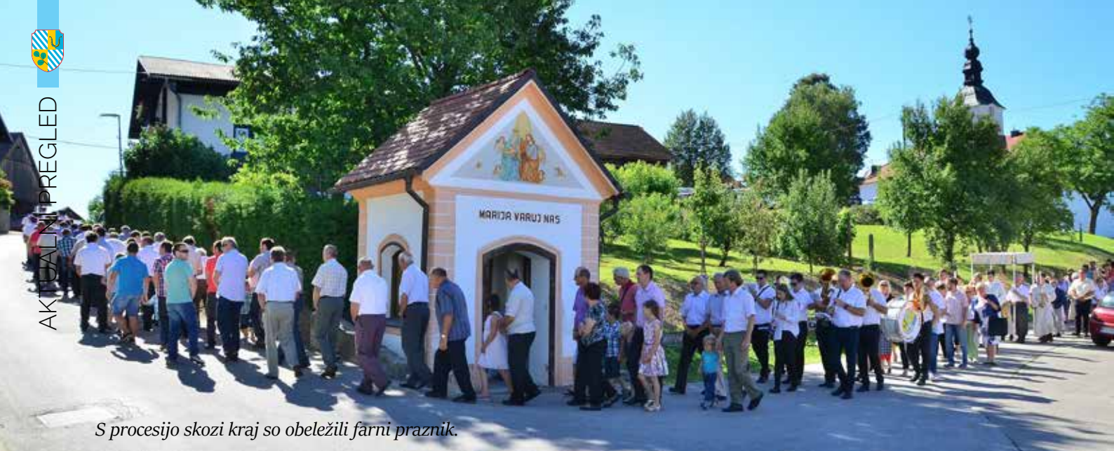
S procesijo skozi kraj so obeležili farni praznik.