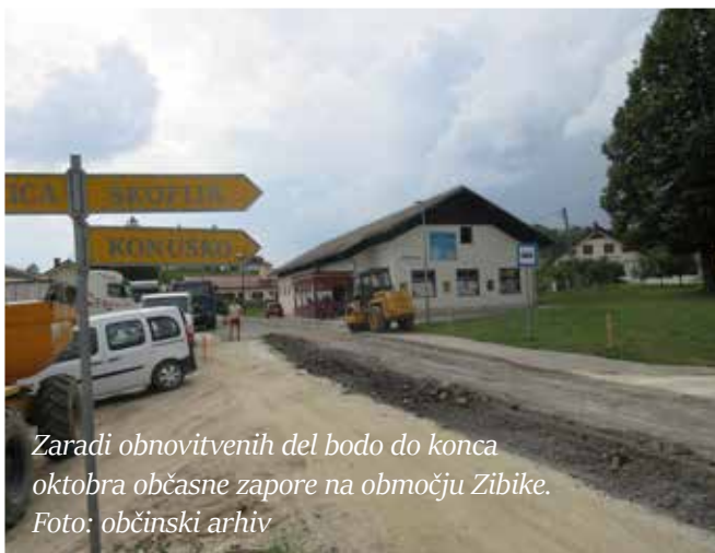
Zaradi obnovitvenih del bodo do konca oktobra občasne zapore na območju Zibike.

opravlja podjetje KIT-AK gradnje iz Rogaške Slatine. V času zapor promet poteka po vzporednih cestah in je označen z ustrežno cestno prometno signalizacijo. Hvala za razumevanje.