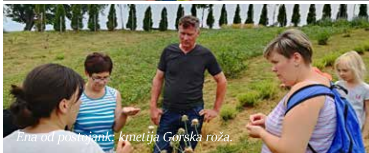
Ena od postojank: kmetija Gorska roža.