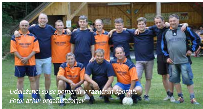
Udeleženci so se pomerili v različnih športih.

V soboto, 17. junija, je v športnem parku Vodenovo potekalo že 11. tradicionalno srečanje vaščanov. Udeležili so se ga vaščani vasi Vodenovo, Srževica, Vrh, Sotensko in Močle. Tudi letos je srečanje potekalo v pozitivnem in razigranem vzdušju ob obujanju spominov, načrtovanju prihodnosti tako mladih kot tudi starejše generacije, ki se takšnega dogodka še posebej razveselijo. Ob lepem sončnem vremenu so se razigrali nogometaši, košarkarji, odbojkarji in otroci s svojo igro. Uživali so tudi tisti, ki so prišli zaradi druženja in stiska roke sosedu ali prijatelju ob kozarčku hladnega piva in dobrega prigrizka.