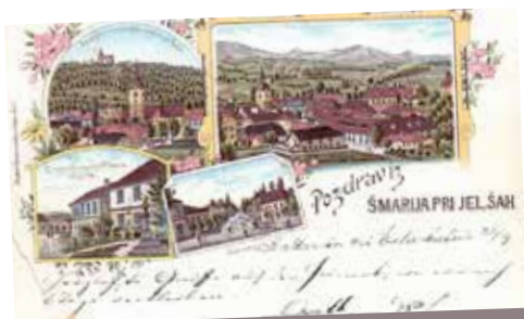
Dopisnica Šmarje pri Jelšah, 1897, najstarejša razglednica Šmarja, na njej je viden kip Franca Jožefa.