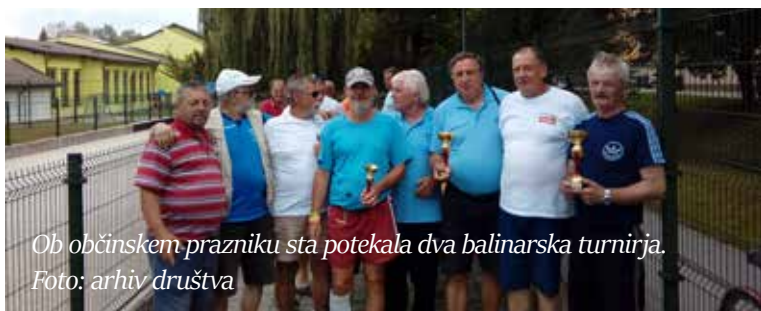
Ob občinskem prazniku sta potekala dva balinarska turnirja.